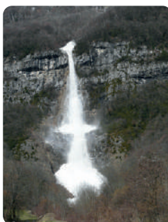
AVALANCHE DE PLAN CRUET