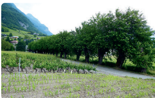
LE CHEMIN DES MÛRIERS