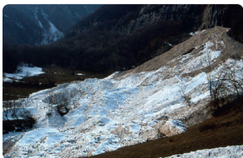
NÉVÉ DE PLAN CRUET