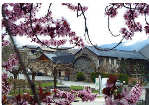
LA GRANDE ROUE